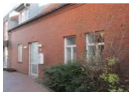
Verwaltungsgebäude Zingelstraße 2b 25704 Meldorf