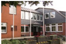
Verwaltungsgebäude Hindenburgstraße 18 25704 Meldorf