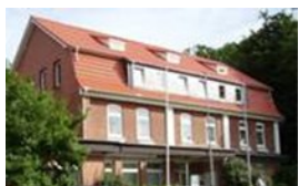
Verwaltungsgebäude Bahnhofstraße 23 25767 Albersdorf