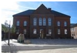
Verwaltungsgebäude Zingelstraße 2 25704 Meldorf