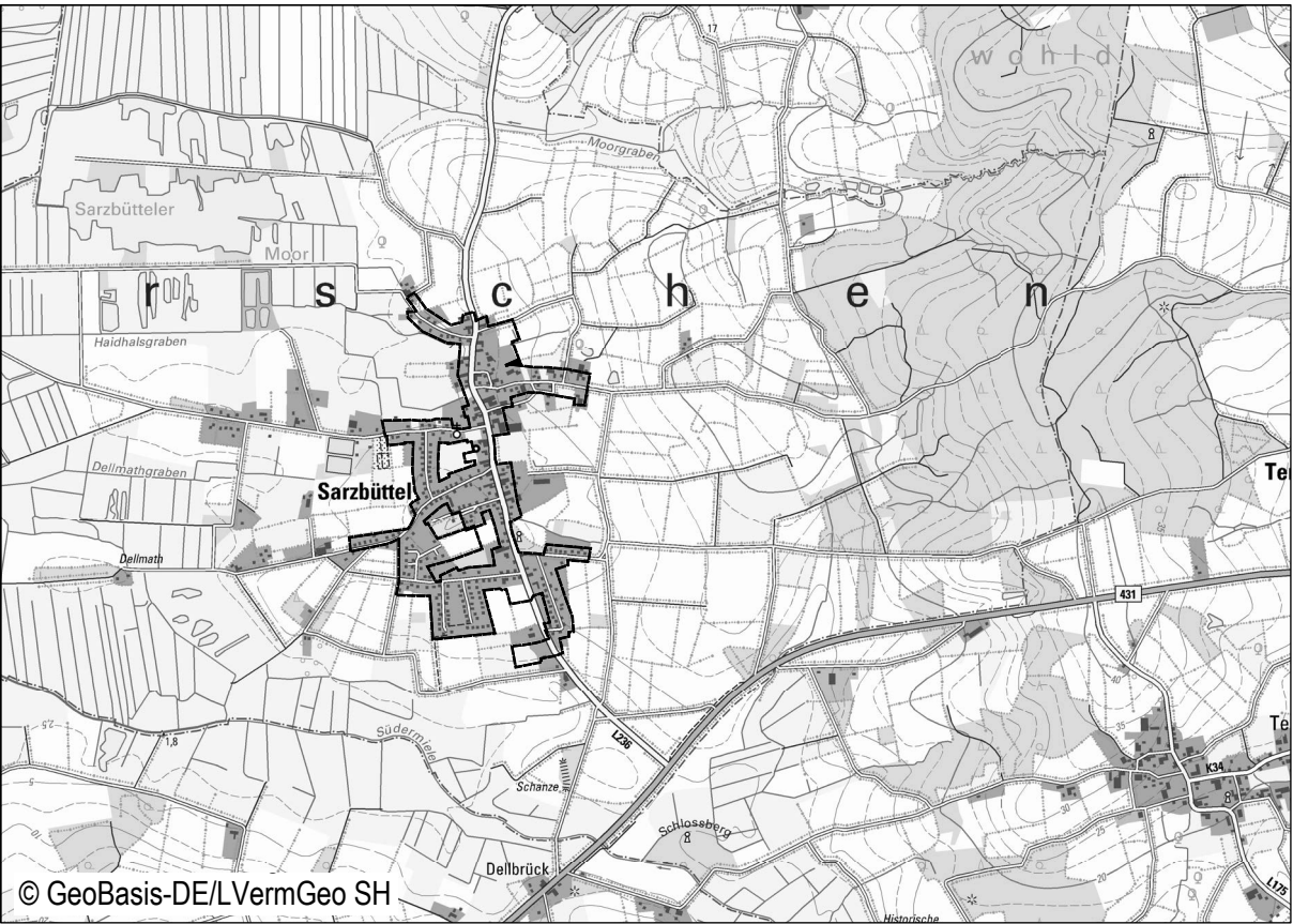
Übersichtsplan ohne Maßstab